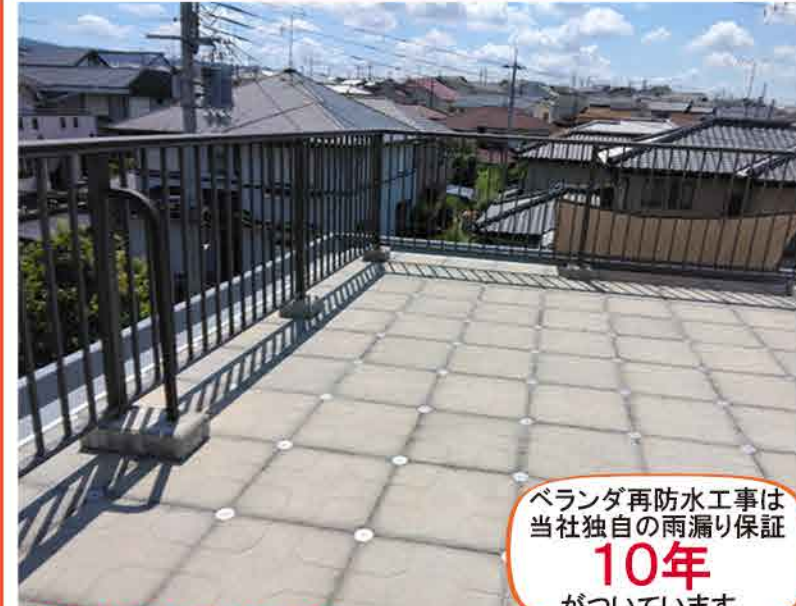
ベランダ防水工事施工事例