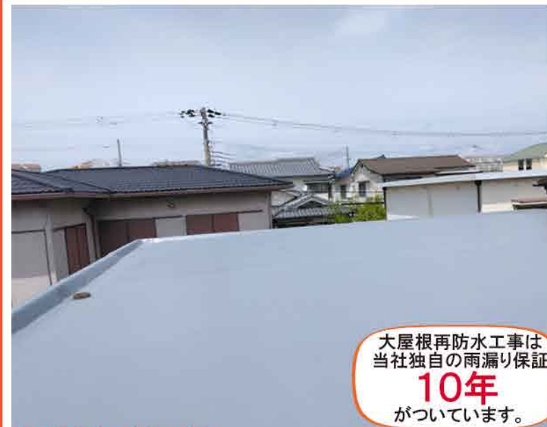
大屋根防水工事施工事例