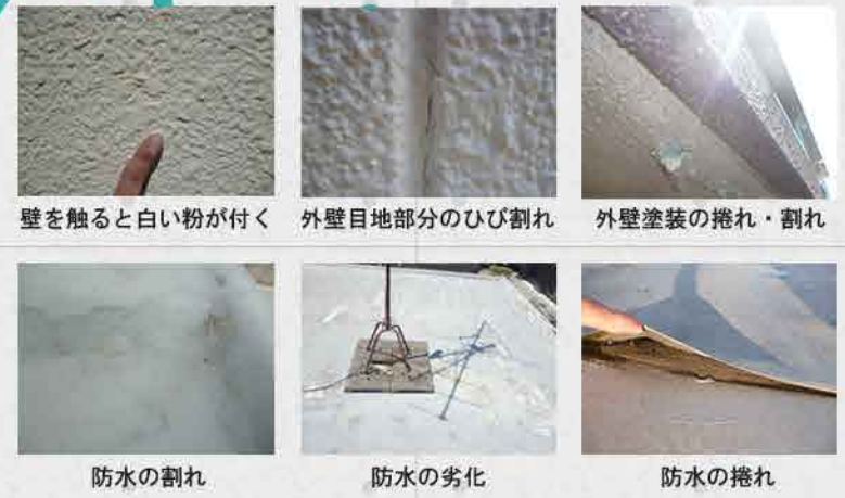
壁を触ると白い粉が付く 外壁目地部分のひび割れ 外壁塗装の捲れ・割れ 防水の割れ 防水の劣化 防水の捲れ

無料点検 実施中！ お住まいのパソコンで 下記のような症状が見られたら要注意！ 早めの点検をお勧めいたします